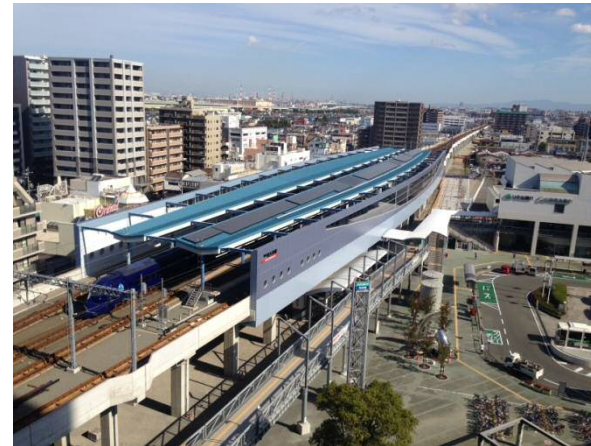
駅上家での太陽光発電