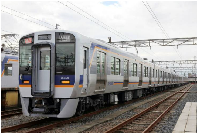
省エネ車両の導入