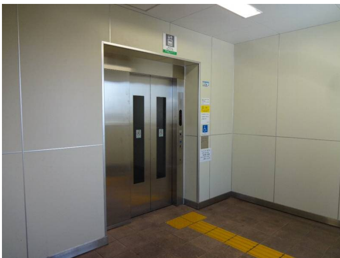
エレベーター設置例