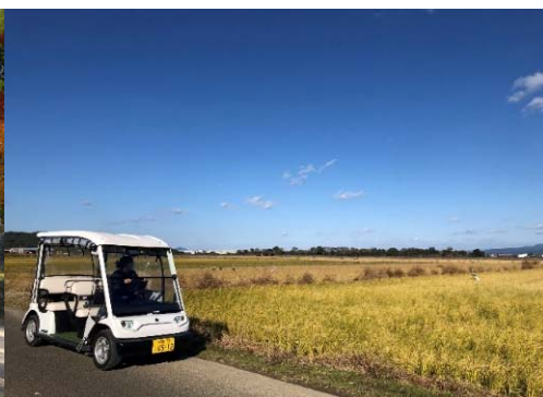
鹿児島県出水市 (ツル観察用レンタカー)