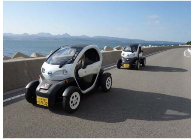
島内移動の脱炭素化