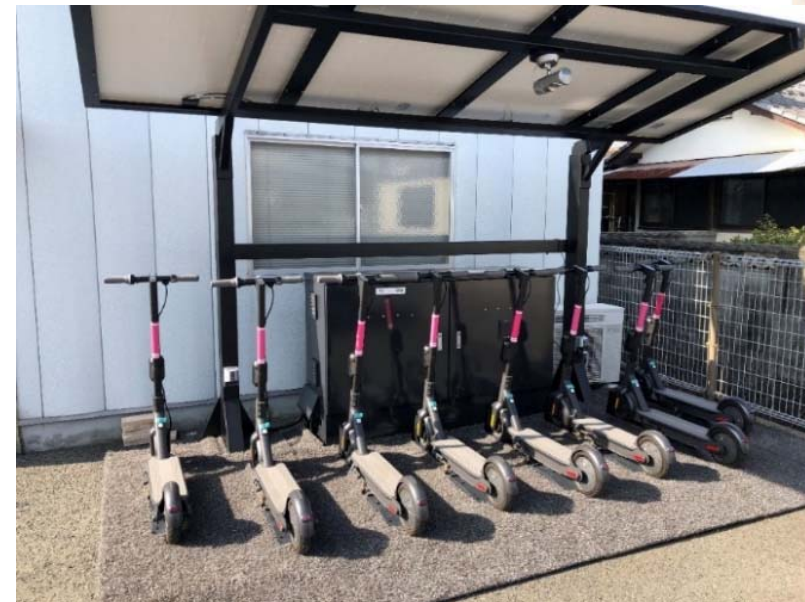
電動キックボード