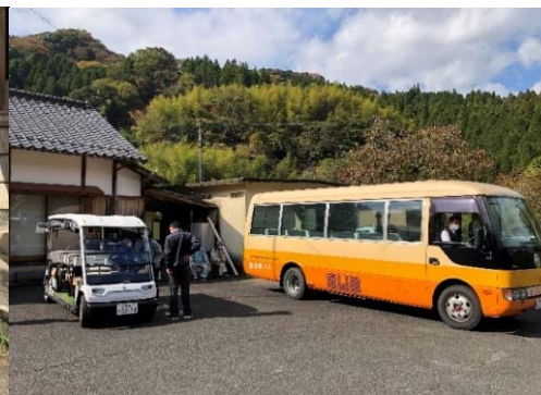
福岡県田川郡添田町/深倉地区 (町バスと接続する地域交通)