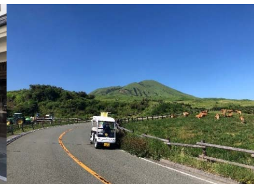
熊本県阿蘇山上 (牧野道ガイドツアー)