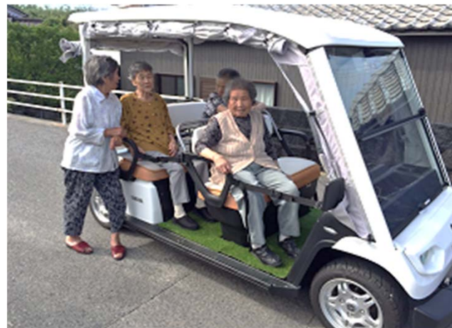
高齢者の外出支援