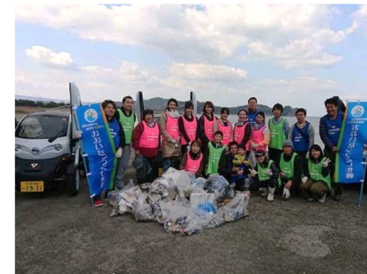
ミス・アース・ジャパンの環境研修