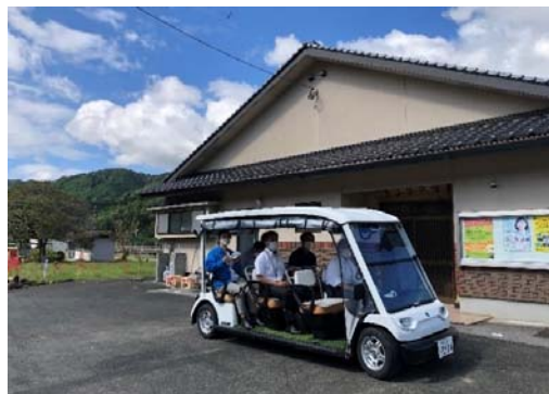
大分県日田市 (最寄駅から集落をつなぐ2次交通)