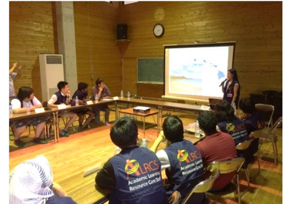
国際学生の環境研修や合宿