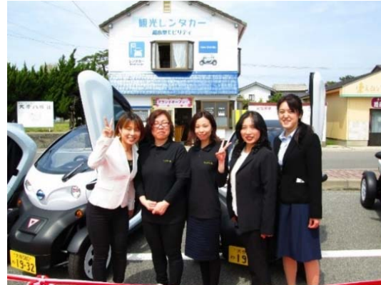
地元の雇用創出と女性活躍