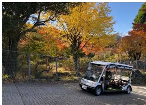
福岡県田川郡添田町 (駐車場より観光客送迎)