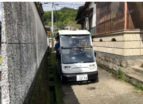
大分県姫島村 (ラスト/ファーストワンマイル支援)