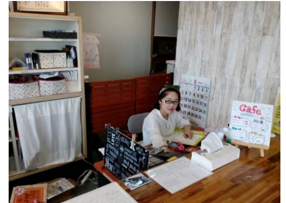
大学生インターンシップ研修