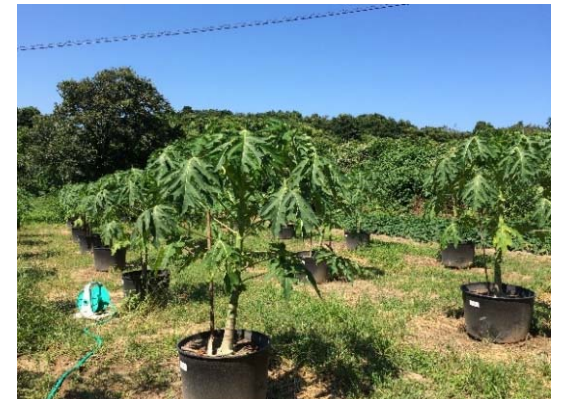
青パパイヤ栽培でCO2吸収と特産品開発