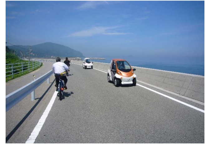
点在する観光スポットへ効率的に