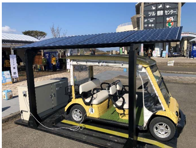
グリーンスローモビリティ