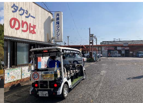
佐賀県鹿島市/高津原地区 (丘陵地帯の住宅街と駅前をつなぐ)