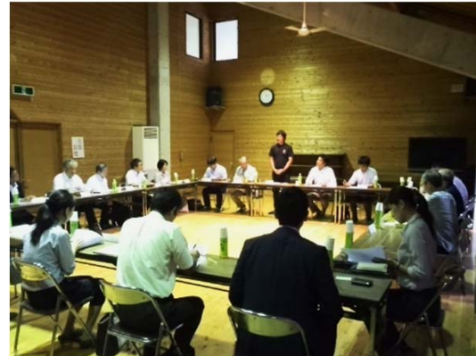
協議会の開催で多数の来島者