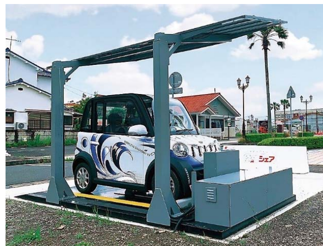
超小型モビリティ