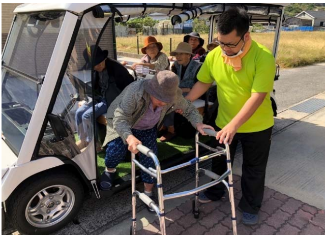
グループホームで活用

ファースト/ラストワンマイルの移動を支える、地域の手軽な新たな移動の足として小型EVの活用