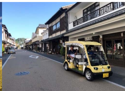
大分県竹田市 (JR駅から観光タクシー)