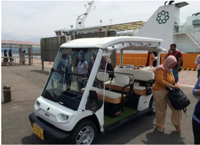
フェリー乗場から繋ぐ二次交通

離島における二次交通の課題解決に、環境に優しい移動手段として小型EVをレンタカーとして活用