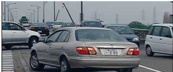
富山市内一般国道415号の萩浦橋付近 (H15.5撮影)