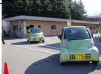
カーシェアリングシステム